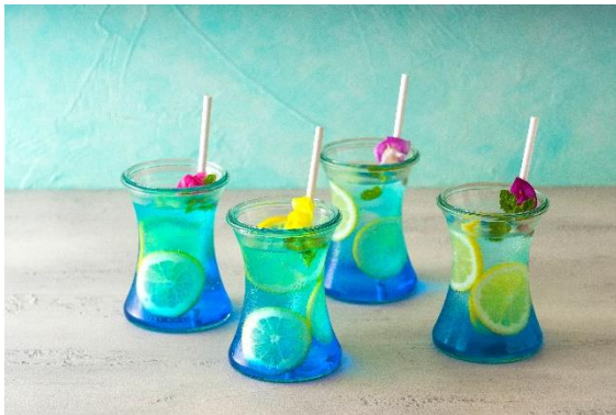
シーサイドブルーレモネード