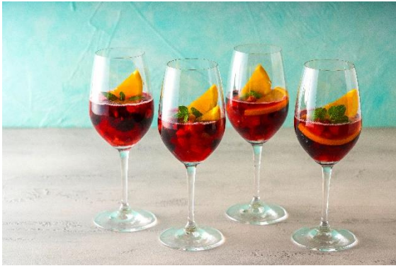
ベリー・ベリー・スピリッツ