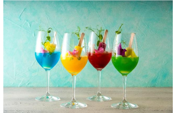
アイスクャンディ・カクテル