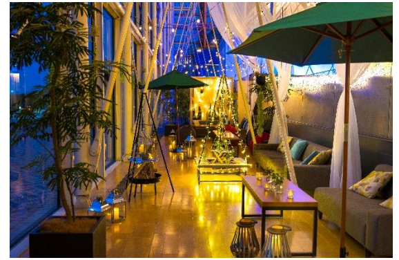
インドア・ビアガーデン(トワイライト)イメージ