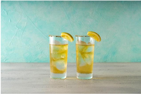
ペッパーシトラスハイボール